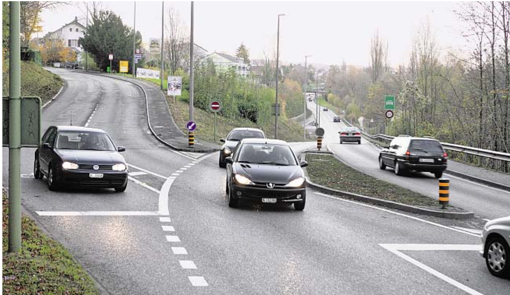
Entlastung. Vor Angenstein wünscht sich Aesch einen Kreislauf und einen Halbanschluss an die H18.

Das letzte Wort hat ohnehin der Kanton. Denn ihm gehört die Strasse. «Wir kennen bis heute keine Tempo-20- oder Tempo-30-Zone auf Kantonsstrassen», sagt Urs Roth, Leiter Geschäftsbereich